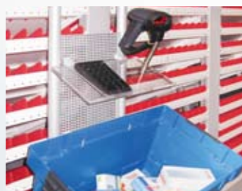
POSTAZIONI DI ARRIVO